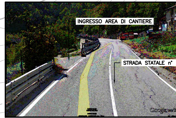
FOTO - 2 - INGRESSO AREA DI CANTIERE