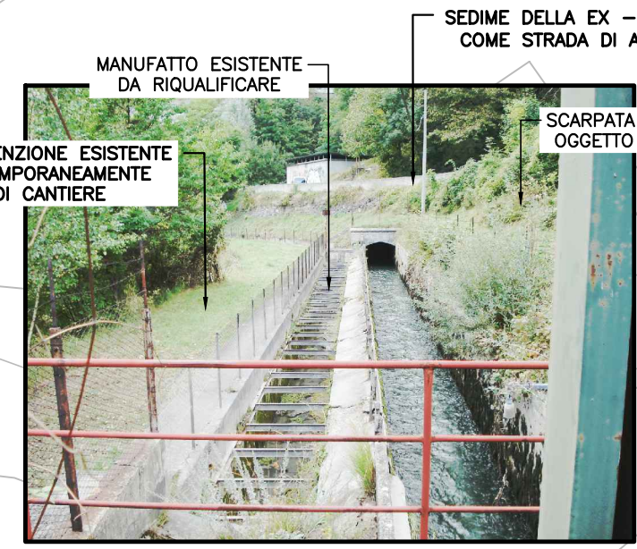
FOTO - 5 - VISTA DELLA TRATTA DI GALLERIA DI DERIVAZIONE A CIELO APERTO E DEL CANALE DI SCARICO DI TROPPO PIENO