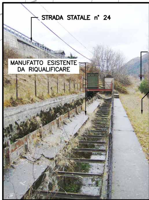
FOTO - 4 - VISTA DEL MANUFATTO ESISTENTE DEL PONTET VERSO L'INGRESSO DELL'AREA DI CANTIERE