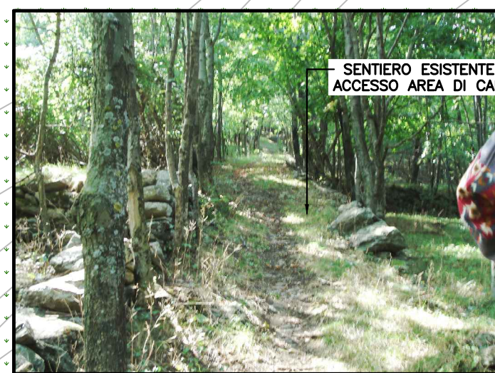
FOTO - 1 - SENTIERO ESISTENTE PER ACCESSO ALL'AREA DI CANTIERE