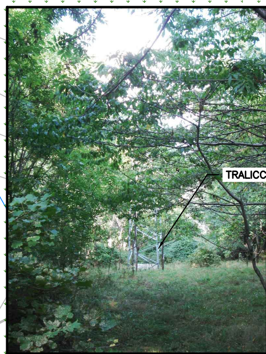
FOTO - 3 - AREA DEL TRALICCIO M.T.