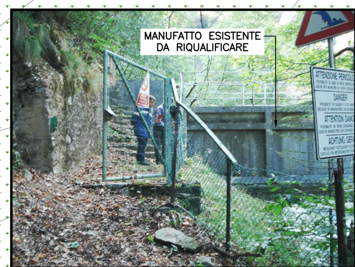
FOTO - 6 - INGRESSO ESISTENTE ALL'OPERA DI PRESA GALAMBRA