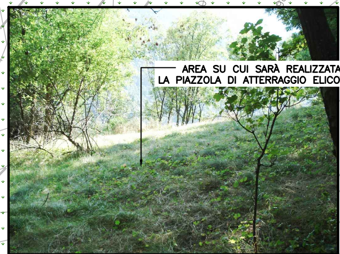
FOTO - 2 - AREA DI REALIZZAZIONE DELLA PIAZZOLA DI ATTERAGGIO ELICOTTERO