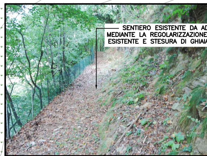
FOTO - 4 - SENTIERO ESISTENTE DA ADEGUARE MEDIANTE LA REGOLARIZZAZIONE DEL SEDIME ESISTENTE E STESURA DI GHIAIA sp. 10 cm