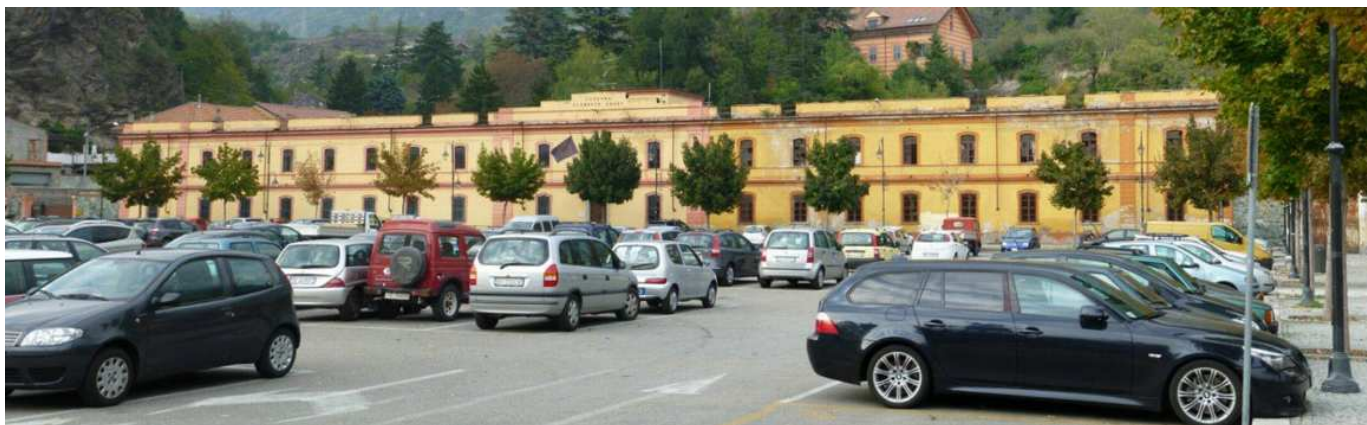
Figura 6 – La caserma vista dal lato sud di piazza d’Armi

Come desumibile dalla ripresa fotografica, è possibile osservare come l’ala attualmente in uso alla Guardia di Finanza (porzione sinistra) abbia cromie differenti rispetto alla parte attualmente in disuso nella quale sono presenti forti elementi di degrado.