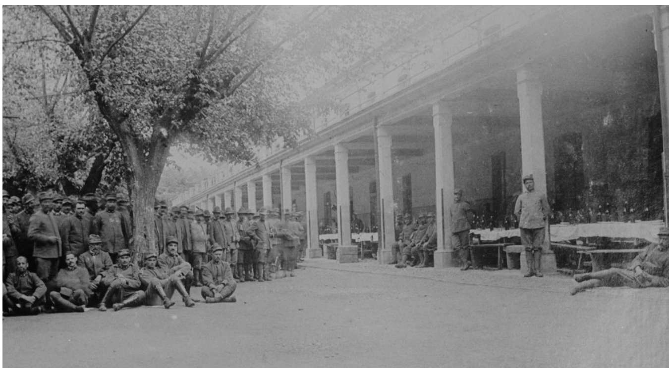
Figura 5 - Il fronte interno della caserma con il portico nel 1915