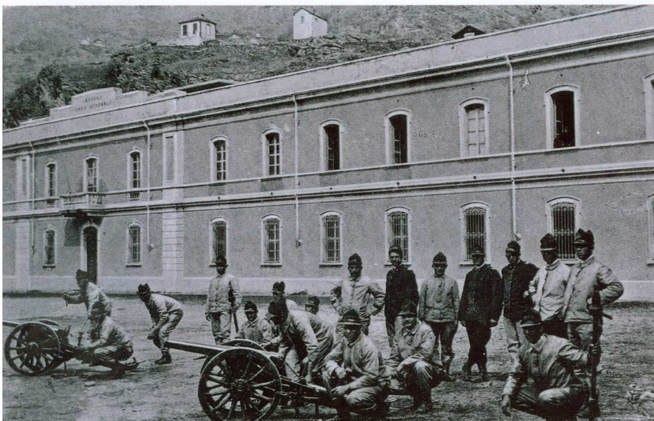
Figura 4 - Il fronte della Caserma Hery ad inizio 900