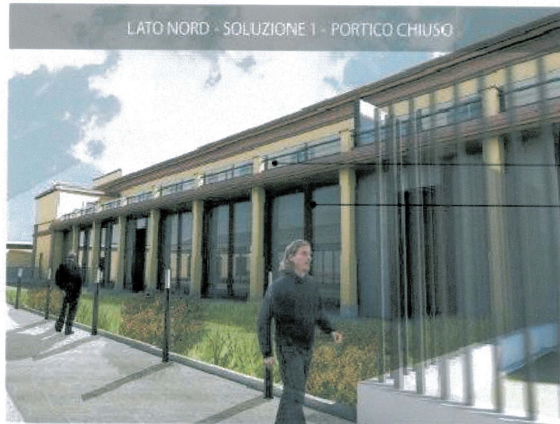
LATO NORD - SOLUZIONE 1 - PORTICO CHIUSO