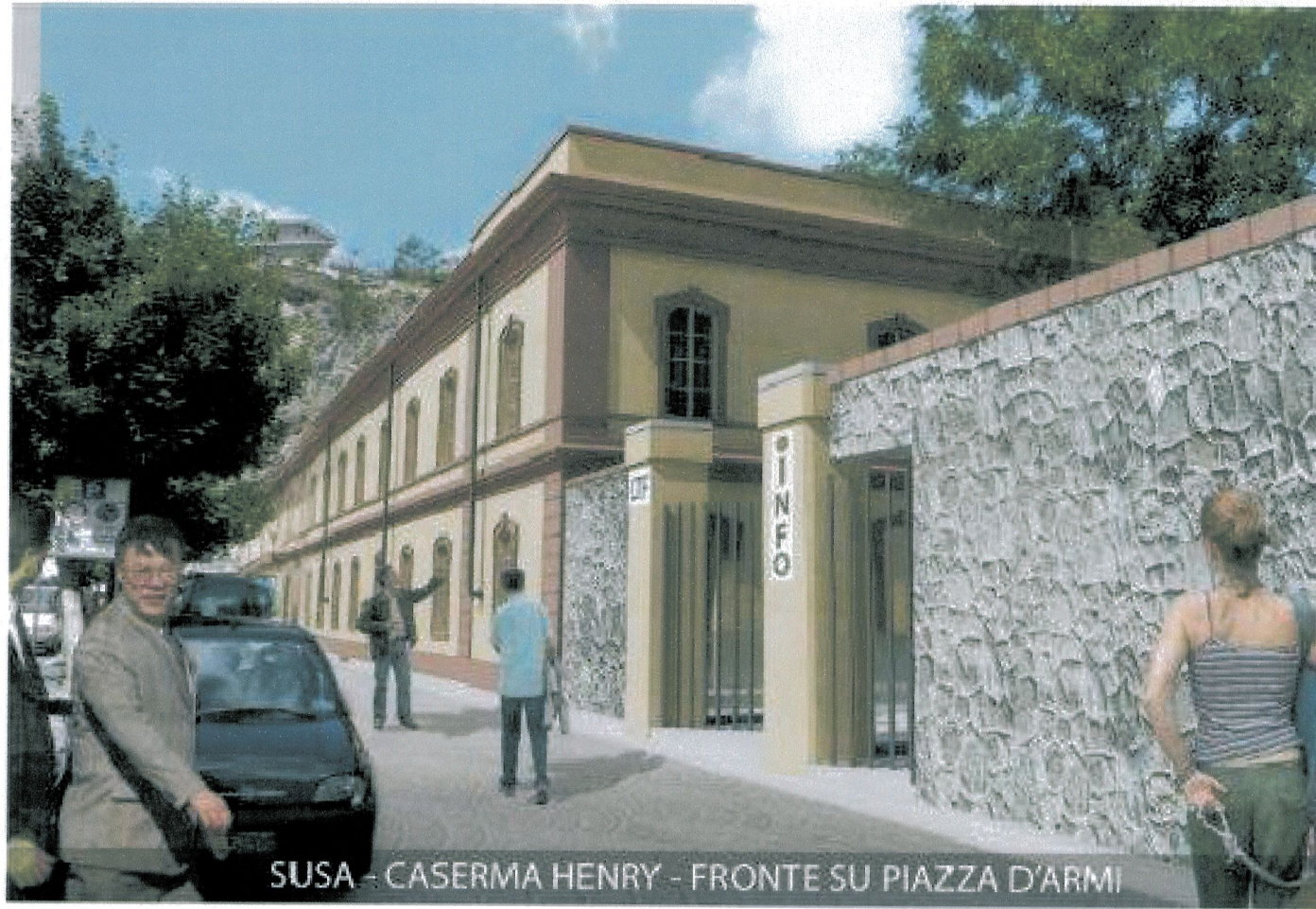
SUSA - CASERMA HENRY - FRONTE SU PIAZZA D'ARMI